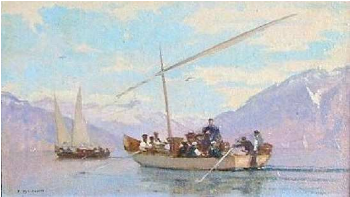
Savoyards embarqués pour le marché huile s/papier s/carton, 17,5x28 cm signée en bas à gauche

Les Savoyards embarquaient régulièrement sur des barques, officiant de bac, pour participer aux marchés vaudois afin d'y proposer leurs récoltes maraîchères. François Bocion a peint deux débarquements dont celui-ci et plusieurs barques emmenant les Savoyards. Notamment pour aller proposer leurs marchandises sur le marché de Vevey.